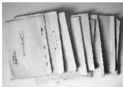
■此次发现的部分日军文献。