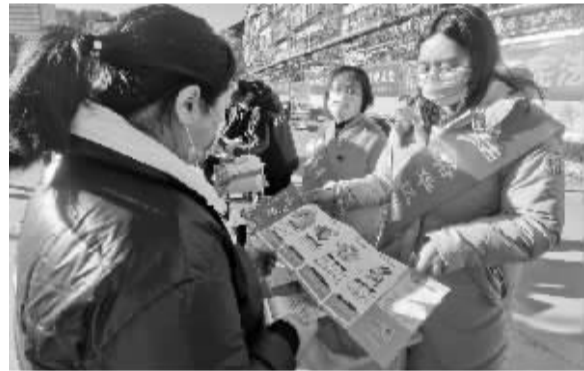
■向群众宣讲法律知识。

本报讯(首席记者 杜慧)在我国第四个“宪法宣传周”到来之际,石市裕华区司法局、区民政局、裕华公安分局、区生态环境局等单位联合在裕华路街道建南社区开展了宪法进社区主题宣传活动。