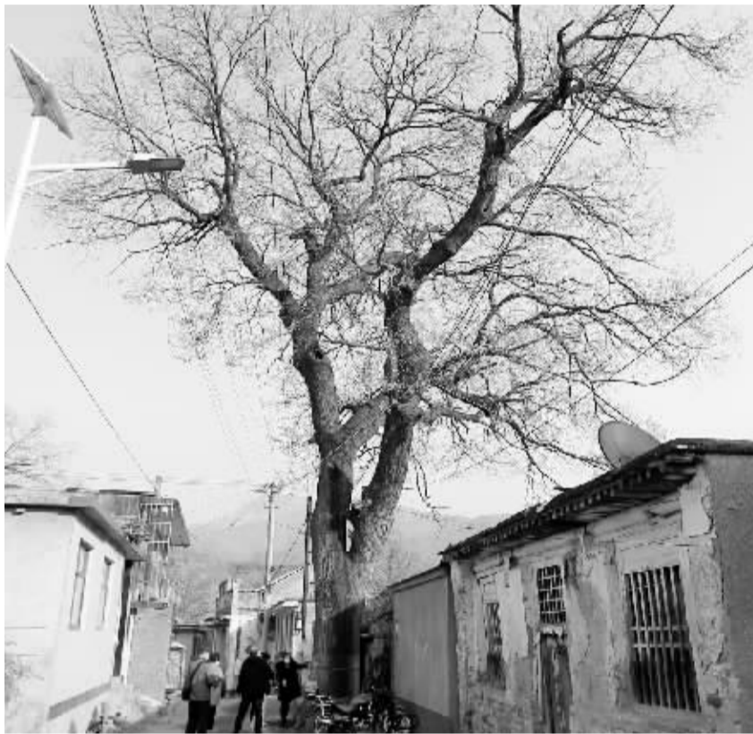
■经过复壮救护的古树，长势良好。