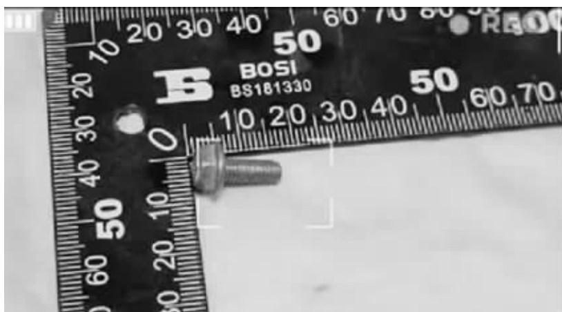
■取出的螺丝钉长近2厘米。