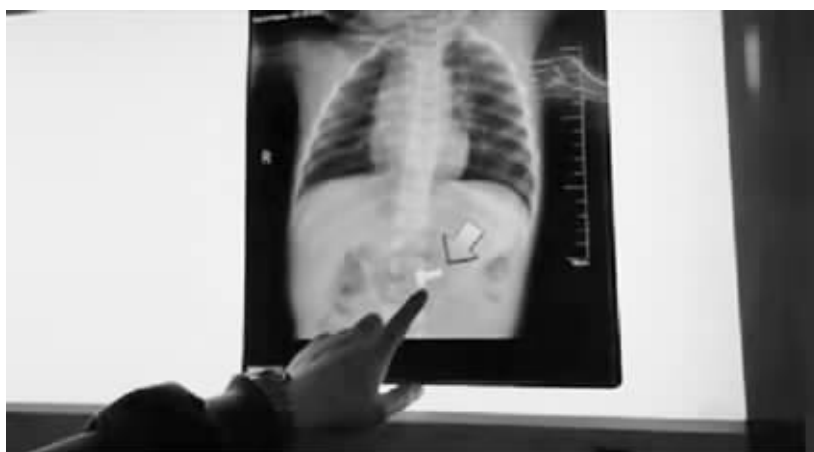
■女童体内的螺丝钉。