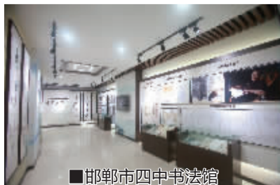
■邯郸市四中书法馆