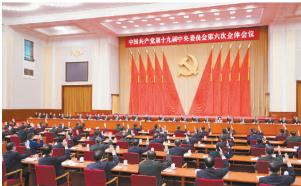
■中国共产党第十九届中央委员会第六次全体会议,于 2021 年 11 月 8 日至 11 日在北京举行。中央政治局主持会议。

新华社北京 11 月 11 日电 中国共产党第十九届中央委员会第六次全体会议公报(2021 年 11 月 11 日中国共产党第十九届中央委员会第六次全体会议通过)中国共产党第十九届中央委员会第六次全体会议,于 2021 年 11 月 8 日至 11 日在北京举行。