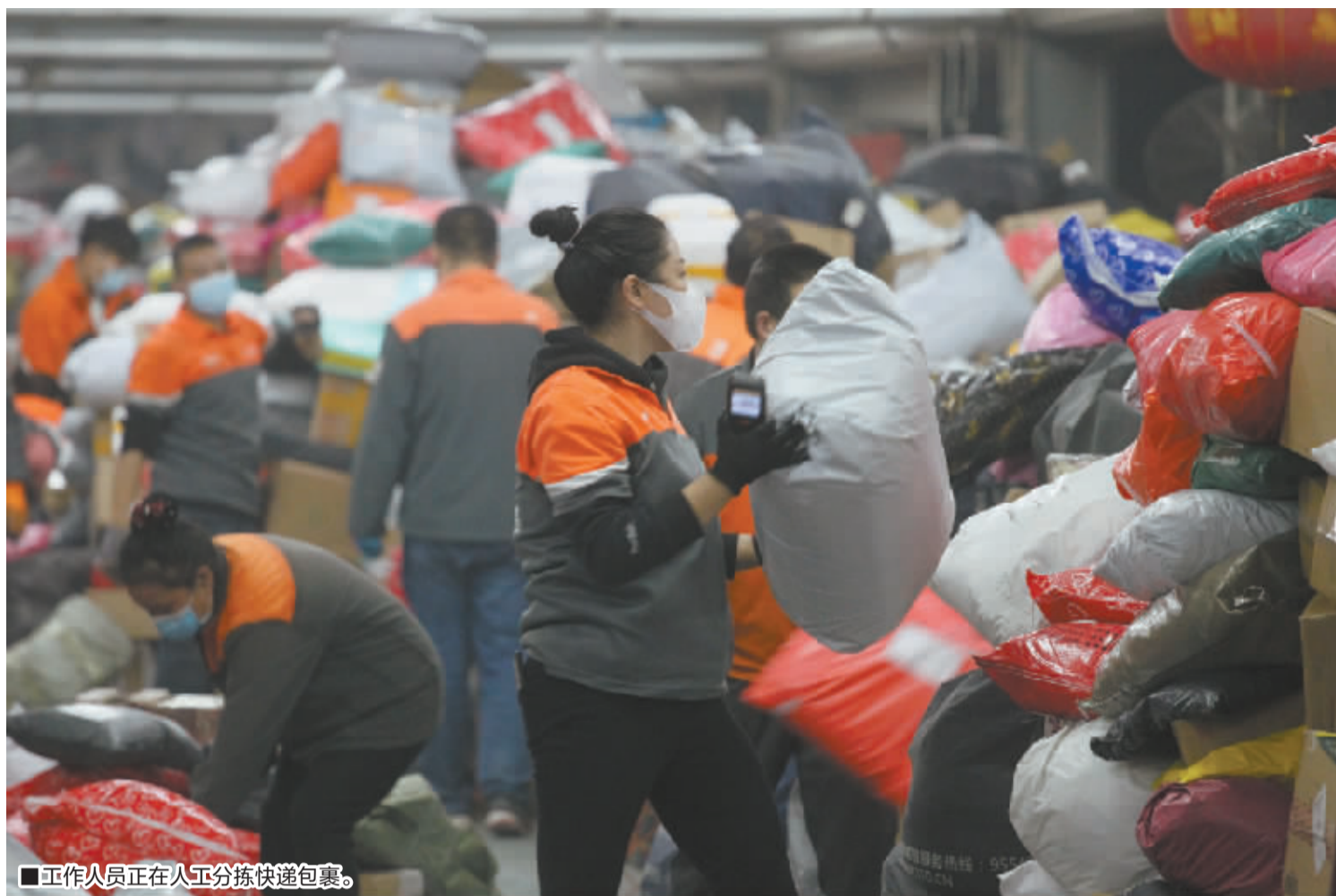
■工作人员正在人工分拣快递包裹。

事件:随着“预售下沉”,今年的“双十一”已提前到来,记者探访石家庄市联合申通快递有限公司时看到,流水线上,第一波高峰的数十万件快递包裹,正经过工作人员的分拣发往千家万户。