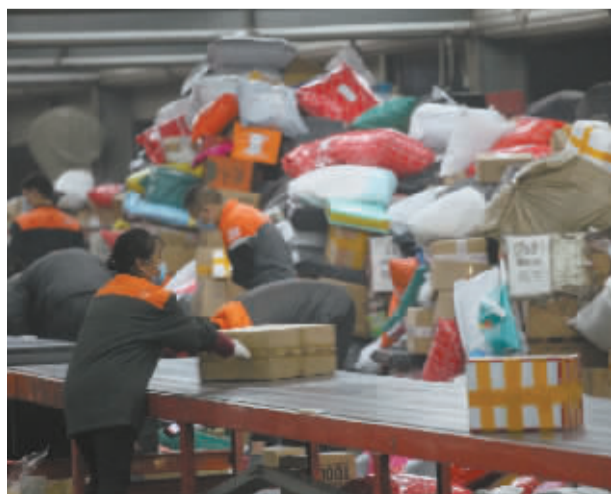
■分拣现场十分忙碌。