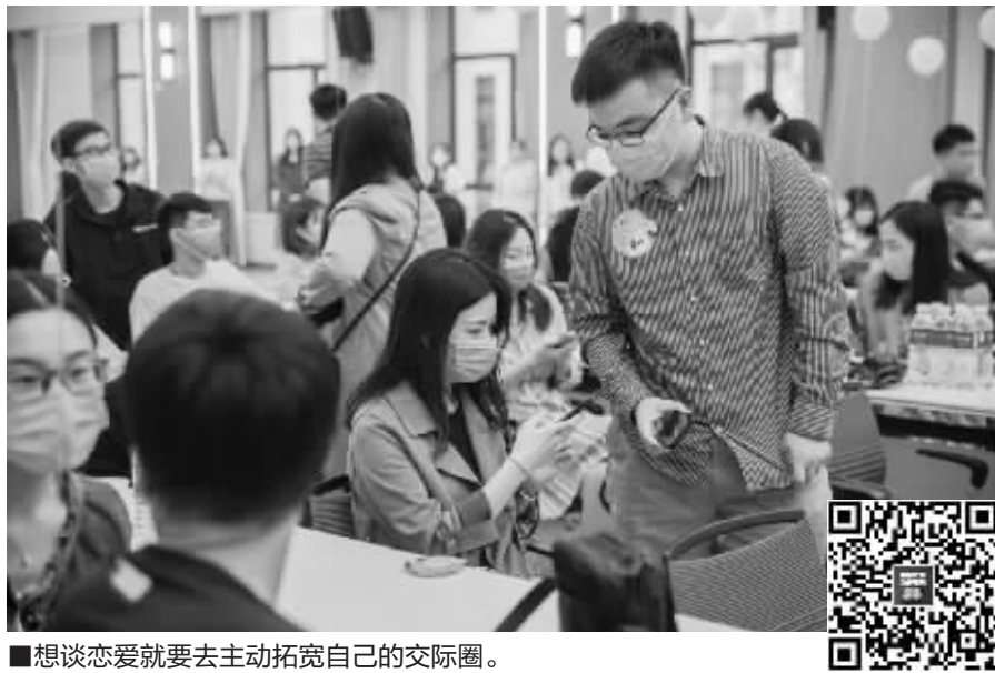
■想谈恋爱就要去主动拓宽自己的交际圈。

三观正的爱情,终将结出爱的硕果。余生,希望有幸在最好的时光遇见你,遇见你之后,都是好时光。作为服务石家庄优质单身的公益相亲平台,我们不仅帮助大家牵线搭桥,还会通过心理辅导帮助单