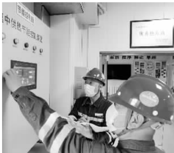
■昨晚,国家电投东方能源热力公司石门站,工作人员记录水温。本报记者 李青 摄

队”和81支“供热管家”团队入社区、进万户,实现225座居民小区、30万户热用户的“全覆盖、零距离”服务,730件问题难题和实事好事在正式供热前得到落实解决。96006客服热线自10月15日起开启24小时模式,提前进入今冬供热状态,“全天候”为30万热用户线上排