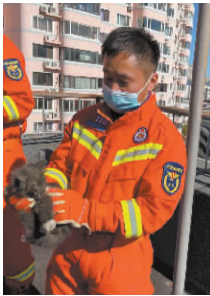
■被困小猫从烟道内被救出。

本报讯(记者 红珊 通讯员 曹庆忠 汤灏)“瞅瞅这小家伙,一身黑、四只小脚丫是白的,这不跟动画片里那只淘气的‘汤姆’长得一样嘛……”10月19日上午,在黑漆漆的烟道里卡了半天的“喵星人”获救时一脸萌相,让忙活了大半天的消防员和居民们忍俊不禁。