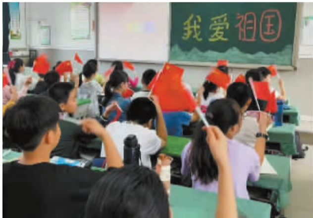
■八一小学举行“我爱祖国”主题班会。