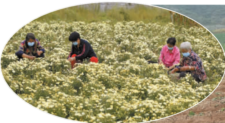
■山清水秀的张家洼村菊花种植基地。

而在南峪镇张家洼村的晶茂园家庭农场,金黄的菊花也长势喜人,一些菊农正提桶挎篮揪着花朵,脸上洋溢着幸福的笑容。据介绍,这些菊花经过加工之后将销往安国药材市场或做成茶饮。