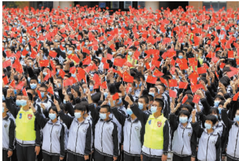
■同学们挥舞着手中的国旗。