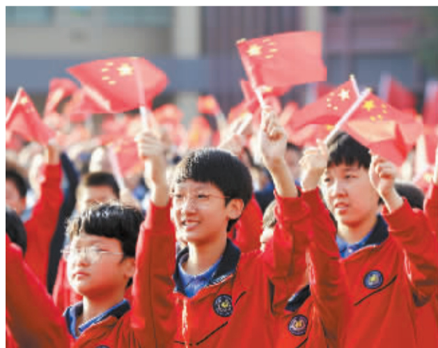
■同学们挥舞着手中的国旗。

40中教育集团巨幅国旗传递仪式在燕赵晚报微博、石家庄新闻网等四大平台进行了全程直播,60多万网友在线观看,并纷纷留言:“振奋人心!少年强则国强!”“祝福伟大祖国繁荣富强!”