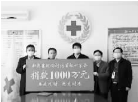
■新奥集团股份有限公司荣获“捐赠企业”奖项。