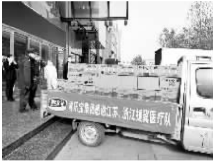
■石家庄君乐宝乳业有限公司荣获“捐赠企业”奖项。