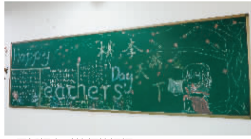
■黑板报上对教师的祝福