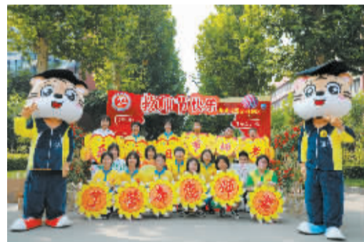
■学生举异形牌祝福老师节日快乐