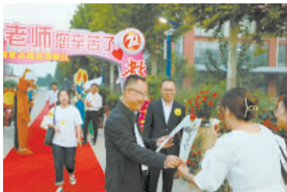
■校长为老师送上教师节礼物