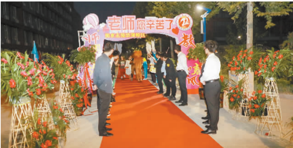
■早晨领导及学生迎接老师