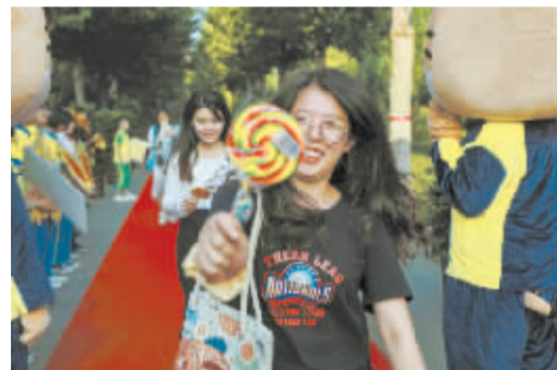
■学校为老师准备的爱心礼物

老师的工作在今朝,却建设着祖国的明天;老师的教学在课堂,成就却是在祖国的四面八方。三尺讲台度芳华,一支粉笔写人生;孜孜不倦育新人,勤勤恳恳浇花朵。在第37个教师节之际,清河志臻学校为平日辛勤耕耘的老师们送上了一个爱意满满的教师节。(文/王志军)