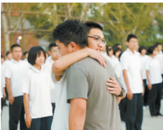
■学生拥抱班主任送上节日祝福

教师是人类社会最古老的职业之一;是人类文化科学知识的继承者和传播者,是人类灵魂的工程师。9月10日,清河志臻学校全校师生喜迎第37个教师节,开展了仪式感充足的教师节活动。