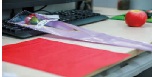
■各年级提前准备的小惊喜