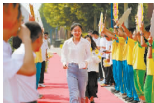
■老师在学生的祝福下走过红毯