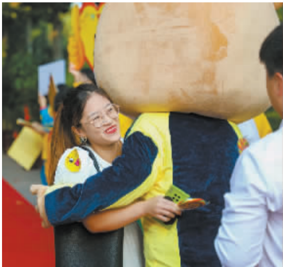
■老师与超越虎拥抱