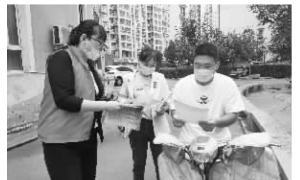
■居民认真阅读“创城信”。

本报讯(首席记者 杜慧)这几天,长安区跃进街道书香尊园社区很多居民陆续收到一封信。这是一封关于创建文明城市的信,信中呼吁广大市民在“团结就是力量”的感召下,牢记社会主义核心价值观,树立强烈的公民意识,持公心、守公德、护公利,争当文明风尚的维护者、美好生活的创造者、美丽省会的建设者。