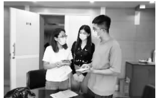
■裕华路街道工作人员宣传人才政策。

本报讯(首席记者 杜慧)为进一步提升人才服务水平,加大惠才优才引才政策宣传力度,9月7日,裕华区裕华路街道基层人才工作站工作人员到辖区重点企业开展人才政策宣传活动,并对企业市管拔尖人才申报人选进行考察。通过与企业负责人现场交流座谈,提升企业对各级人才政策的知晓度,加快人才政策落地。