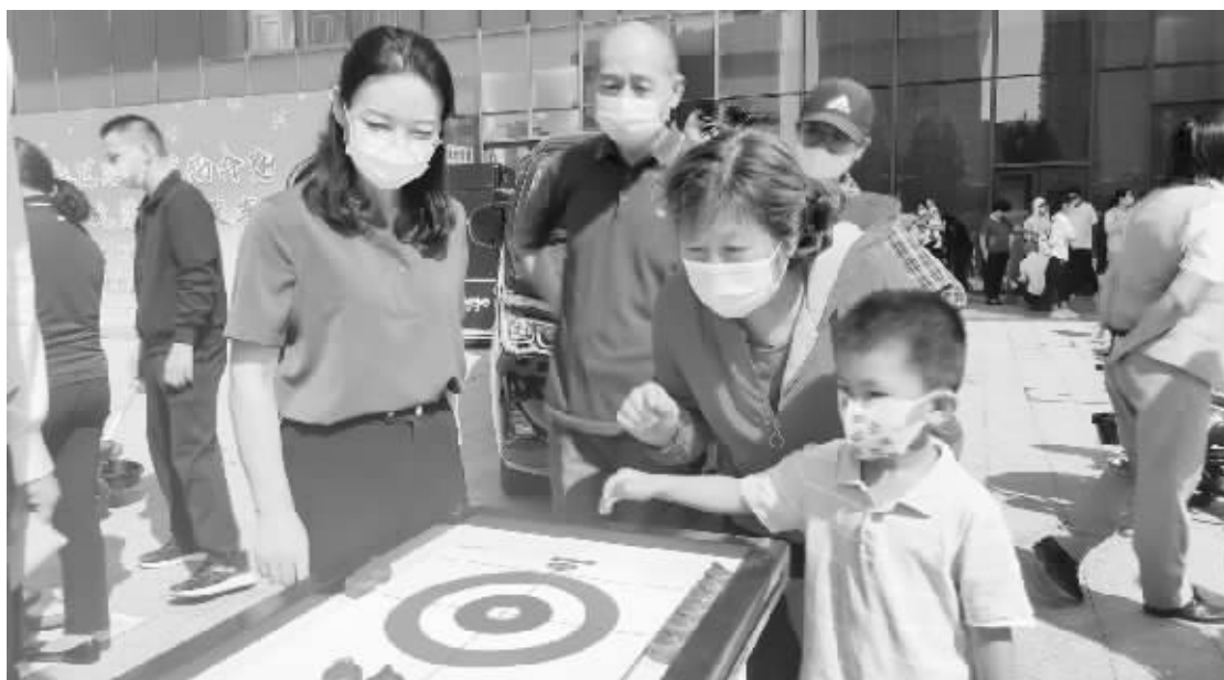
■居民在家门口享受冰雪运动的乐趣。

本报讯(首席记者 杜慧)“这是我第一次玩陆地冰壶,很新鲜,很有意思!”9月8日上午,在新华区社区冰雪运动会暨新华区冰雪“大篷车”发车仪式现场,来自天河悦城小区的崔女士体验完陆地冰壶项目后,一脸兴奋。