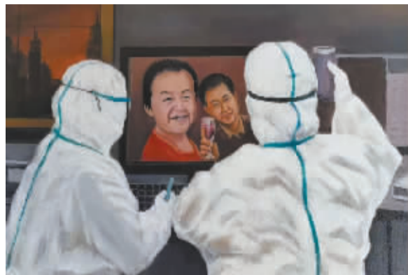
■《庚子年 石家庄 除夕夜》(油画) 张和平

晚报书画版现遴选出石家庄市老年大学学员近期创作的部分优秀作品予以刊发,以飨读者。