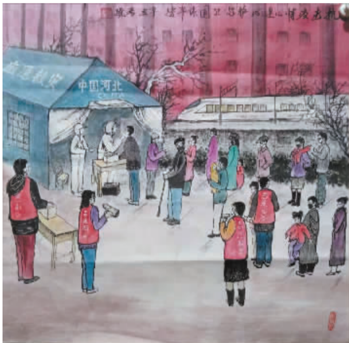
■《抗击疫情心连心》(国画) 刘彦璞