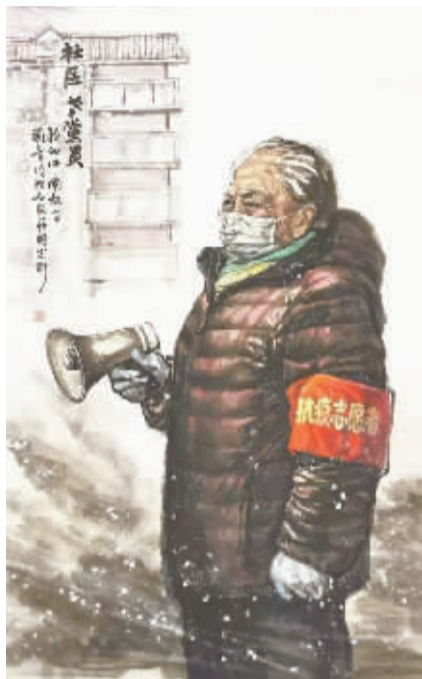
■《社区老党员》(国画) 邱国晋