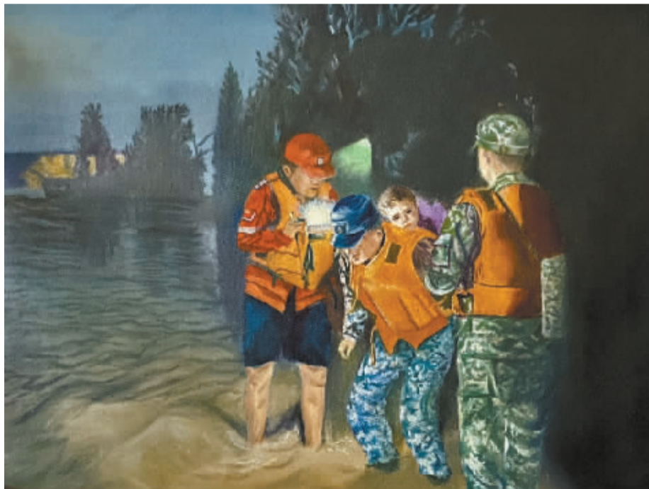
■《心系灾区人民》(油画) 陈秀云