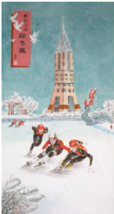
■《燕赵儿女迎冬奥》(国画) 鲍卫东