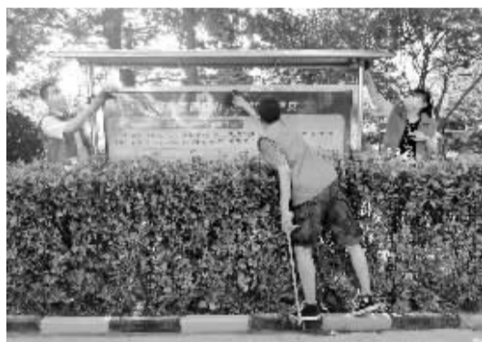
■书香尊园社区的“志愿红”在擦拭宣传栏。

如今,在书香尊园社区,“志愿红”随处可见。在社区工作人员的带领下,越来越多的居民群众加入“志愿红”队伍。他们传递爱心、传播希望;他们真诚温暖、无私奉献。他们用实际行动,让烈日下的“志愿红”更加鲜艳。