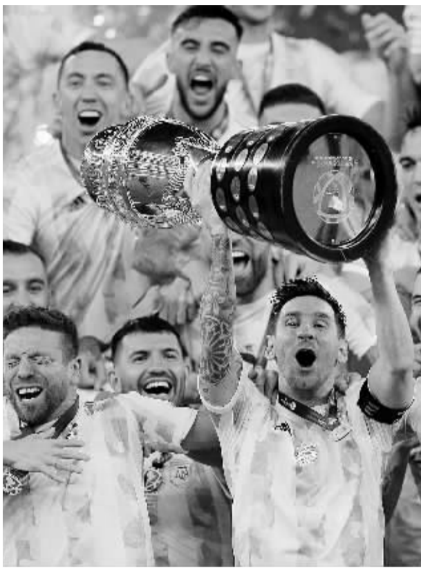
■梅西高举美洲杯冠军奖杯。

经过一个月的鏖战,欧洲杯、美洲杯两场足坛大戏落下了帷幕。意大利队在温布利点球大战击败英格兰夺得欧洲杯冠军,让全英格兰沉浸在了失落与悲情之中;而南美大陆则书写着潘帕斯雄鹰新的传奇,阿根廷队力克巴西夺得美洲杯冠军,34岁的梅西首夺国家队成年国际大赛冠军,幸福虽晚但分量足够。