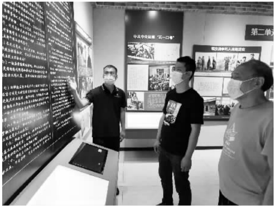
■游客参观李家庄统一战线展馆。