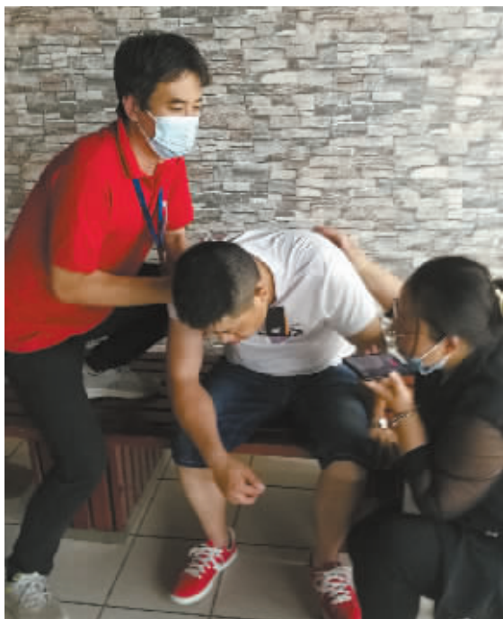
■超市员工救助发病男子。

21时20分许,该男子的哥哥赶到了现场,随后120急救人员携带担架也赶到了。此时,该男子意识有所恢复,嘴里不断念叨着:“我差点儿就死了!”并多次对救他的超市员工表示感谢。最终在超市员工的协助下,该男子被抬上担架由急救