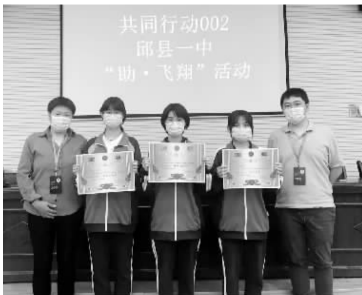
■河北省共同行动助学基金会助力学子冲击中高考。

据悉,本次“助飞·翔”活动,将于中高考前在邱县一中、深州中学、新河中学、吴桥中学、衡水中学等河北省32所县乡中学陆续举办,受益对象为在中学阶段接受过共同行动资助的897名农村中学生。“每一个接受共同行动资助的孩子,在爱心人士、志愿者的精心呵护下,如同雏雁一般不断成长、羽翼丰满。我们希望在他们即将展翅飞翔之际,再次为他们助力,让他们感受到