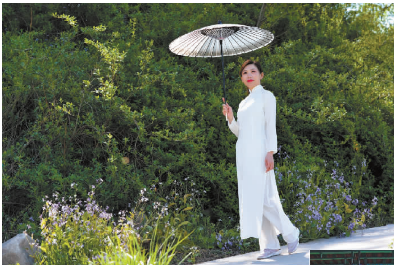
■徜徉春风里。