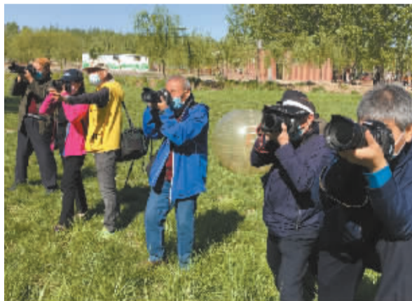
■各有各姿势。