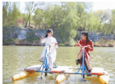
■共享水上自行车。