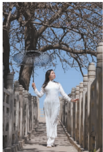
■桥头丽影。