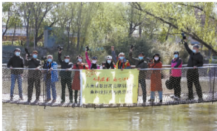
■采风学员合影。