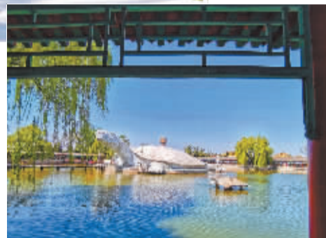
■东方神龟。

旅人游汲汲，春气又融融。独惭出谷雨，未变暖天风。4月17日，谷雨时节渐近，虽然没有贵如油的春雨，省会却迎来了一个暖风和煦的晴朗春日。当日上午，晚报摄影培训班十几名学员走进平山县冶河东岸的东方巨龟苑景区，“山中海世界，石上万卷书”，以红、绿、古、新为特色的各色景点，让前来的游客目不暇接。学员们更是快门不停，在本报专业摄影老师的悉心指导下，用手中的长枪短炮定格一个个美丽的瞬间。“我是一名老学员，几乎每一期的活动都参加，户外采风不仅将课堂上的理论知识和实践结合起来，更锻炼了身体，为我们提供了一个交流学习的互动平台。”闫大姐乐呵呵地说。