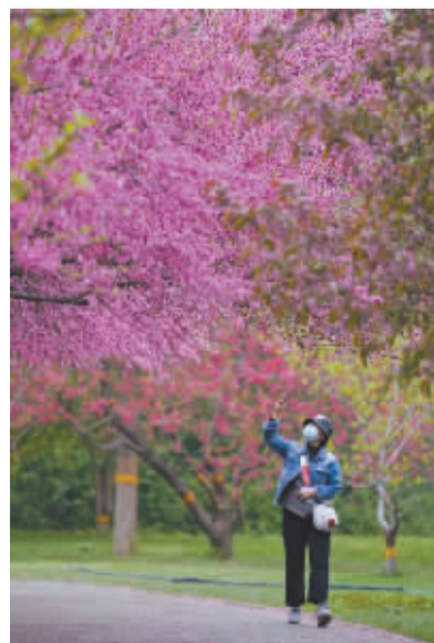
■一树繁花。