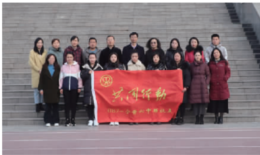
087 志愿团(宁晋六中)志愿者合影

徜徉于国学经典中,感受传统文化的脉搏,087 志愿团在领航志愿者和志愿者老师们共同努力下,开设了公益凤凰国学课堂。