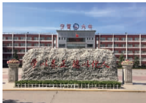
宁晋县第六中学校园

087 宁晋六中帮扶点 建点时间:2018年05月20日 累计资助学生:122名 正在资助学生:62名 累计接收善款:397100元