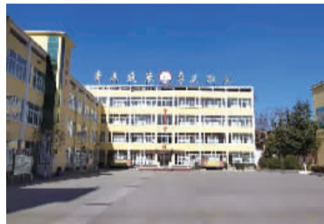
■涉县鹿头中学校园

037 涉县鹿头帮扶点 建点时间:2010年07月24日 累计资助学生:230名 正在资助学生:49名 累计接收善款:555420元