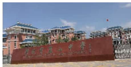
■河北省盐山中学风貌

088 盐山中学帮扶点 建点时间:2018年05月18日 累计资助学生:246名 正在资助学生:175名 累计接受善款:3222647元