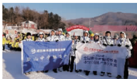
■10名丰羽生参加全国青少年国防体育大赛荣获团体总分冠军、团体体育道德风尚奖