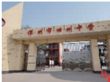
■ 深州市旧州中学校园风貌

013 旧州中学帮扶点 建点时间: 2009年03月13日 累计资助学生: 311名 正在资助学生: 30名 累计接收善款: 688108元