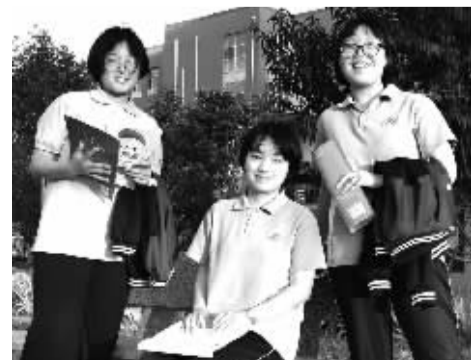
■044 志愿团为即将毕业的培羽生拍照留念