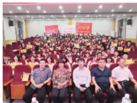
河北饶阳中学、共同行动的老师们与016饶阳中学帮扶点的培羽生共度中秋