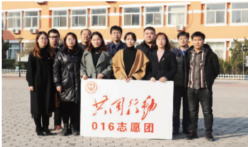
016 志愿团(河北饶阳中学)的老师们在校园合影

愿团组织培羽生参观了耿长锁纪念馆。在纪念馆内,同学们认真观看一幅幅珍贵的图片、一件件耿长锁用过或是没舍得用过的实物,仔细聆听一个个真实的故事,详细地了解了这名老劳模的先进事迹。老劳模心怀坦荡、光明磊落的品格让同学们敬佩;同学们在耿长锁雕像前重温了共同行动誓词,更加坚定了对共同行动的承诺与初心。本次参观活动,使同学们思想得到了洗礼,精神得到了升华,心灵受到了触动。