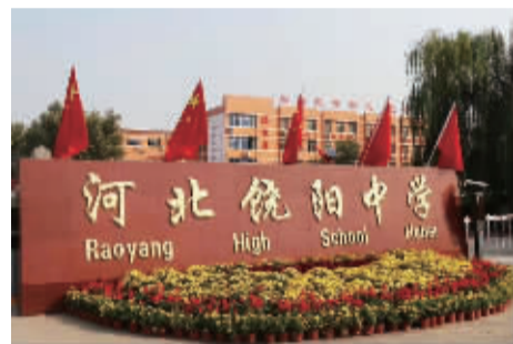
饶阳中学学校风貌

016 饶阳中学帮扶点 建点时间:2009年04月21日 累计资助学生:660名 正在资助学生:145名 累计接收善款:1562550元