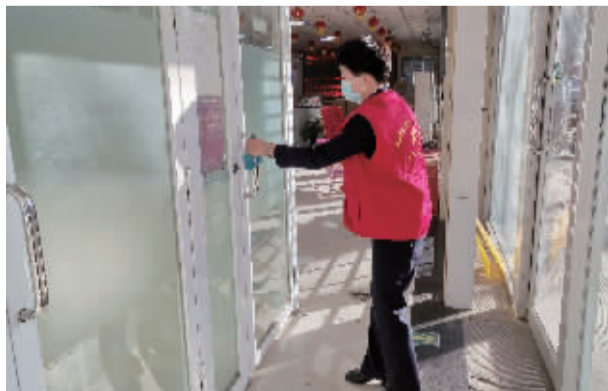
■根据分区分级管控工作安排,邮储银行石家庄市分行辖内网点陆续有序复工。图为1月29日,邮储银行石家庄市分行营业部工作人员营业前做准备工作。(张圆圆)