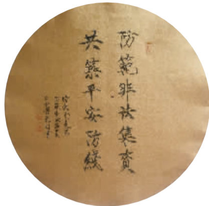
■作者 邢台金融办 东明