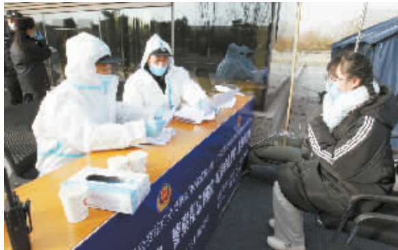
■一名刚下火车的大学生来到了救助站求助。