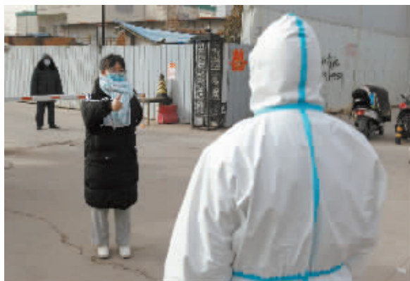
■大学生伸出大拇指给民警点赞。