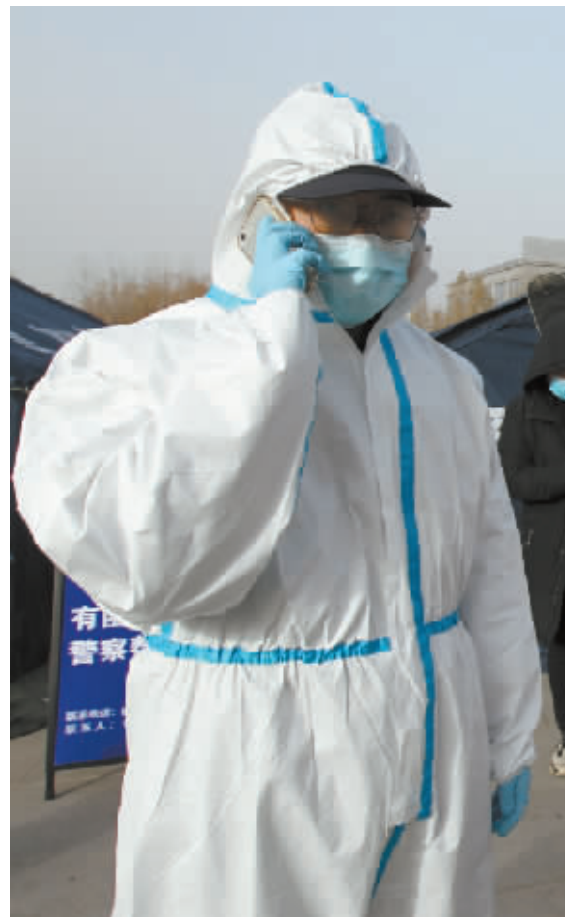
■民警与滞留乘客居住地负责人联络。

民警提醒:疫情当前,石家庄压力很大,在外地务工求学的石家庄人,如非必要尽量在原地过年。