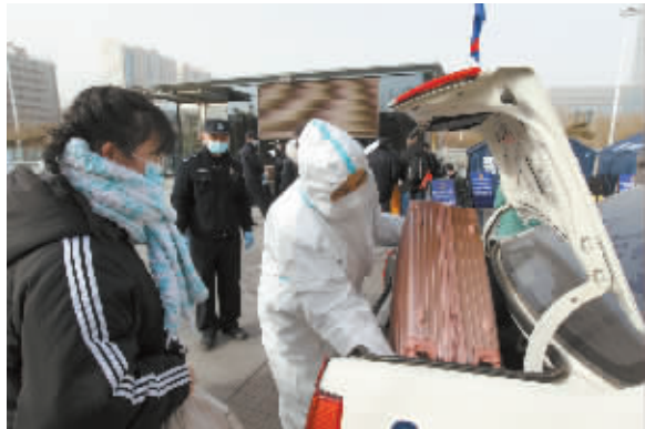
■民警将大学生的行李装上车。