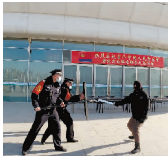
反恐应急演练现场。

邢台市邮政分公司还专门制作“卧牛城”纪念封,贴《辛丑年》生肖邮票一枚,搭配特制“卧牛城”文化日戳,供广大集邮爱好者收藏实寄。此次《辛丑年》特种邮票发行暨“卧牛城”文化日戳启用后,对提升邢台“牛城”知名度和城市竞争力,建设大美牛城、活力牛城、幸福牛城有着积极的推动作用和深远的影响。