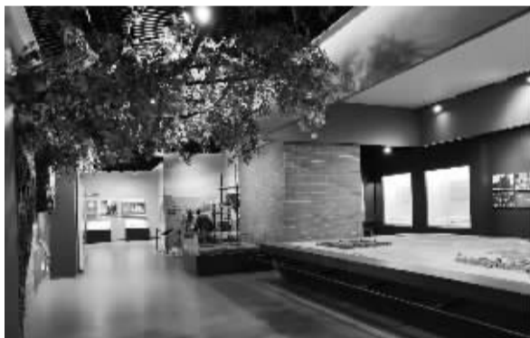
■大名县博物馆明清厅。

秦皇岛市玻璃博物馆: 是我国第一家国有玻璃专题博物馆。整个园区依托始建于1922年的耀华玻璃厂遗址建设,建筑遗址为国家级文物保护单位。有西方古代玻璃展柜、中国古代玻璃展柜,有当代玻璃工业展区,有琳琅满目的当代玻璃艺术品。此外,还精心设置了玻璃现场制