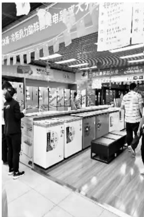
惠民补贴活动中最受喜爱的家电是冰箱和洗衣机。

买家电可享现金直补,石家庄市家电惠民补贴活动进入倒计时。由石家庄市人民政府主办、石家庄市商务局承办的石家庄市家电惠民补贴大型促销活动将截止到 9 月 30 日,有想购买电器的消费者,还有 3 天购买机会。