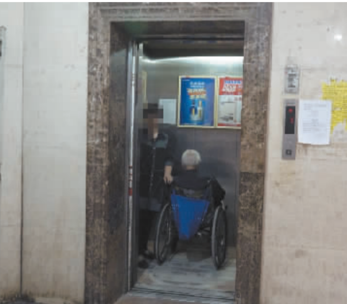
■电梯故障频出,180户居民出行受阻。

可家住石家庄市新华区龙城公寓的居民们却因电梯频繁出故障,苦不堪言。一栋楼,180户仅有两部电梯,且其中一部已故障停用。15年老旧电梯故障频出,百余户居民出行受阻。面对物业的解决方案,居民不能达成一致。高龄电梯不堪重负,更换电梯成了这些居民亟待解决的事。