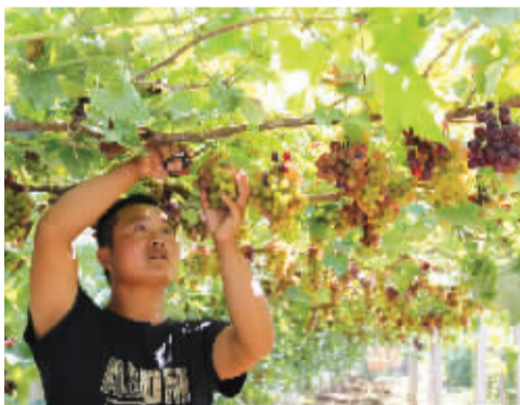
■在松会葡萄采摘园,工作人员正在采摘葡萄。