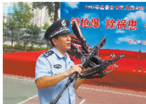
■收缴的仿真枪、弩等非法物品。

省公安厅有关负责人表示,全省公安机关将对涉枪涉爆违法犯罪始终保持严打高压态势,深入推进打击整治枪爆物品违法犯罪专项行动,坚决铲除枪爆祸患,全力为经济社会发展和人民安居乐业创造良好的治安环境,以优异的成绩迎接中华人民共和国成立70周年。