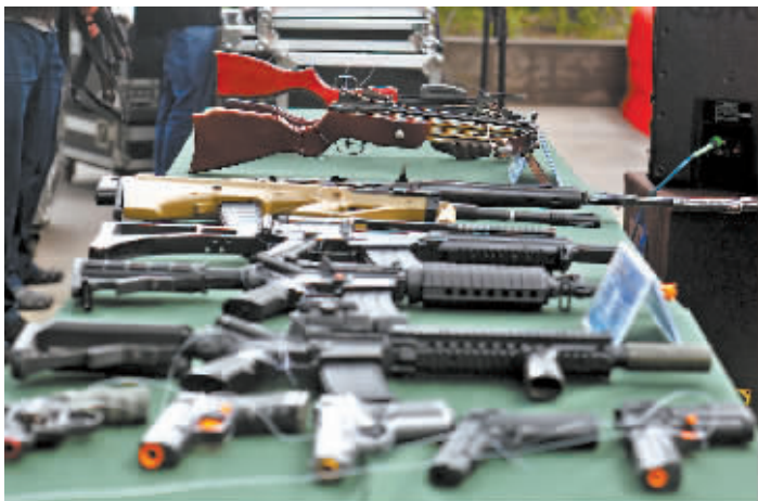
■各类非法枪爆物品展示。