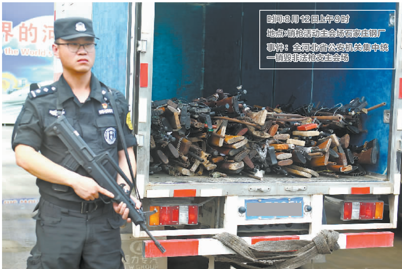
■收缴的枪支装车,准备运往钢厂销毁。