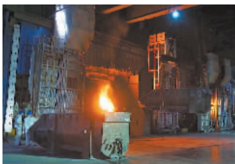
■在炼钢炉中销毁。(视频截图)