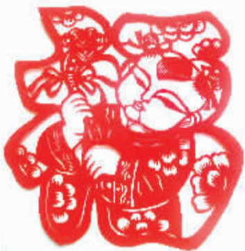
剪纸 / 郭现强

过年没几天，我特意学习公众空间一样，把 WiFi 密码用艺术字打印出来，如年画般贴在电视