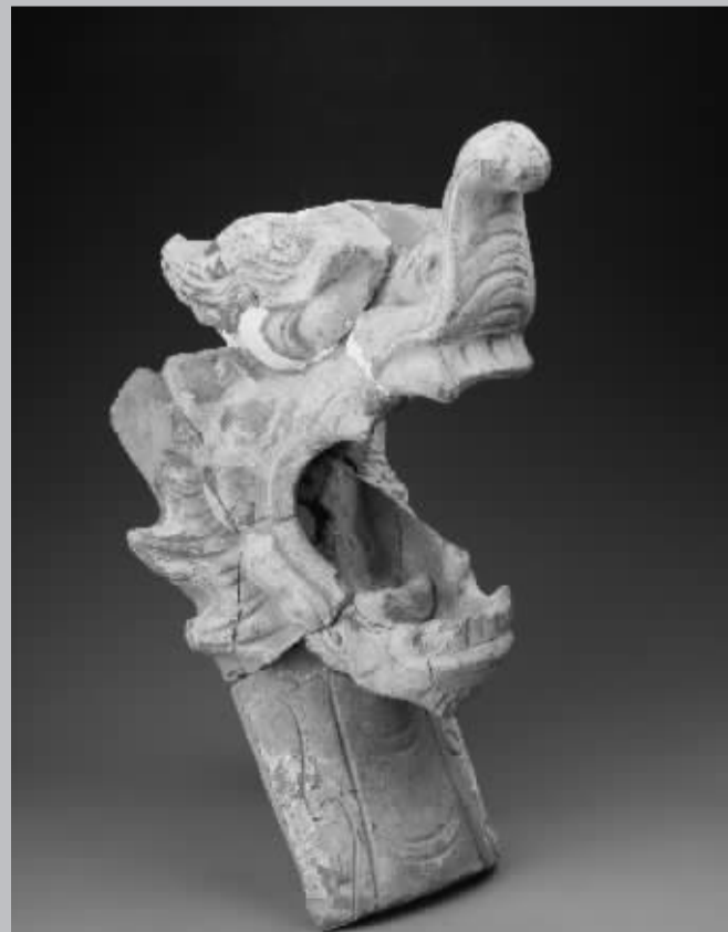
■泥质灰陶龙形脊饰