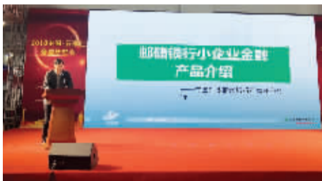
■金融单位展示多样化融资产品