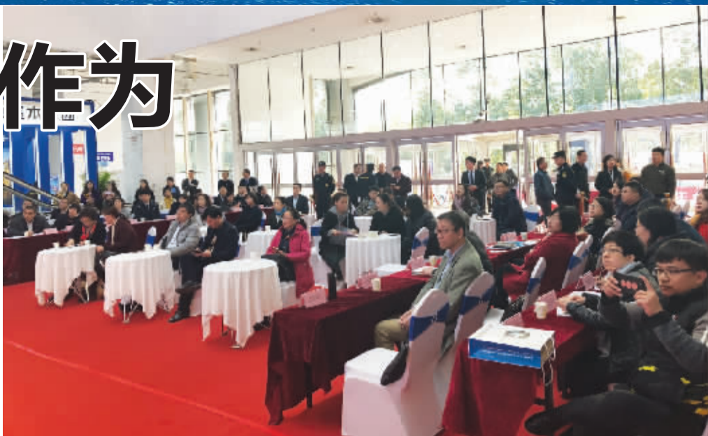
■“4+4”对接沙龙吸引了很多企业金融单位参加

参会的金融单位也纷纷展示自己的多样化金融产品。工商银行石家庄分行展示了针对中大型企业、小微企业不同的融资产品。其中针对小微企业，有网络循环贷、纳税信用贷、小微企业银政通业务等。中国邮政储蓄银行石家庄市分行展示的金融产品也很多，诸如快捷贷：手续简单，放款迅速，而且可循环使用；小微易贷：额度高，放款快，从申请到审最快只需5分钟，申贷人不用跑银行，全程在网上解决；税贷通：针对连续正常纳税