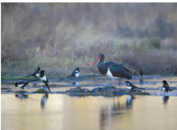
■黑鹤与喜鹊和谐相处。