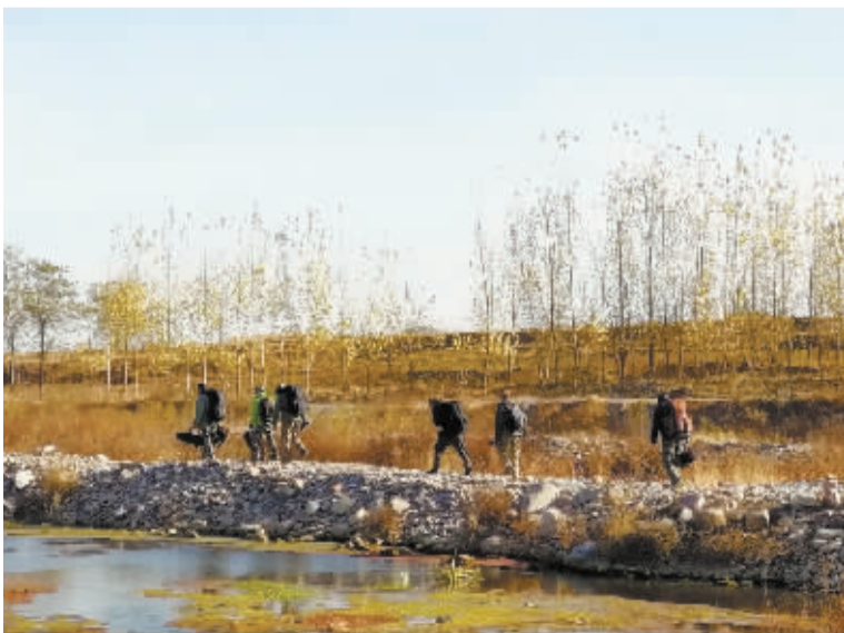
■摄影爱好者赶来拍摄。

随着冶河水量增加,河道生态和环境明显改善,鸟类、鱼类的种类数量不断增加。11月18日,井陘县与平山县交界的冶河流域内,迎来了成群的水鸟,其中有黑鹤、秋沙鸭、冠鱼狗、赤麻鸭、白鹭等几十种水鸟,此起彼伏的鸟叫声仿佛让岸边的人置身于鸟的王国。