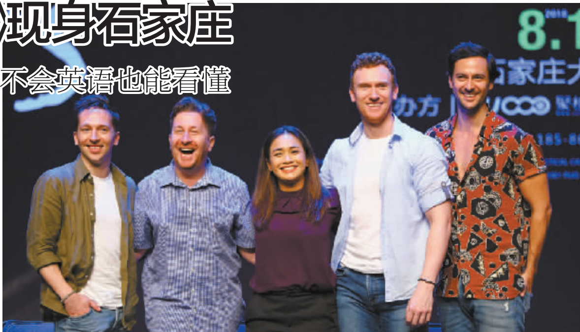
■《猫》剧组亮相。

“谢谢”、“中国很好看”……昨天的见面会上,该剧驻场导演戴恩、音乐总监马修、“魅力猫”的扮演者乔安娜、“摇滚猫”的扮演者约翰与“英雄猫”的扮演者格里格齐齐