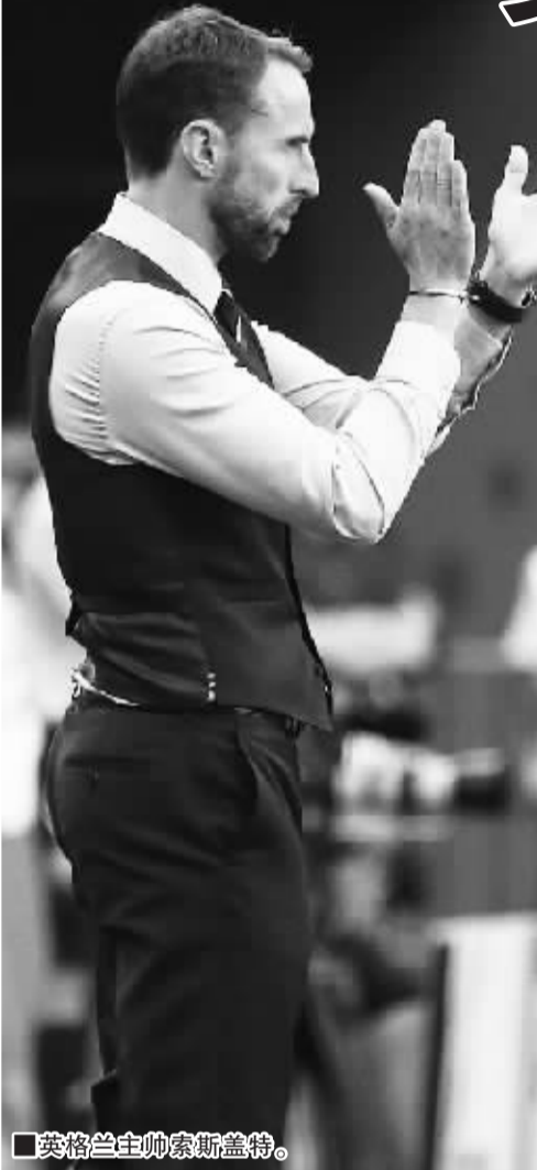
■英格兰主帅索斯盖特。