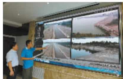
148个监控摄像头无盲区观察水库。