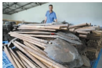
查看铁锹是否完好。