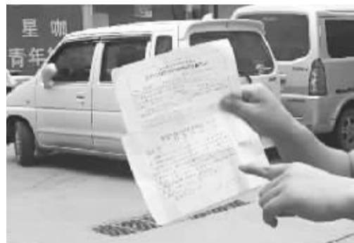
■两个月过去了,廉先生有车不能开。

廉先生如确实只是用白酒漱口,而没有“饮酒后驾驶”,并在规定的时间做了抽血检测,血液显示正常的,则可以走行政复议相关程序,取回驾驶证,但需要和长安交警大队沟通,由大队来做好善后工作。