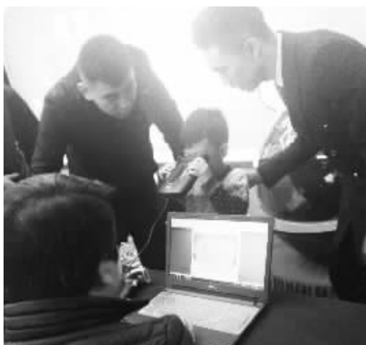
■虹膜录入过程。

据了解,中国儿童虹膜防丢网络平台建设是“互联网+儿童保护”行动的重要抓手和核心内容。该行动由中国关心下一代工作委员会公益文化中心联合有关单位在全国开展,旨在运用互联网新技术、新思维,探索建立现代儿童保护体系。目前,