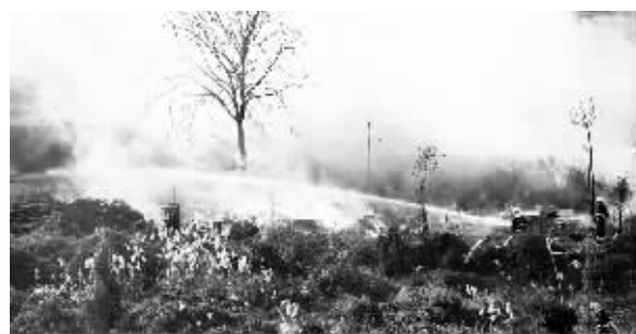
■消防官兵全力灭火。

平台已在全国建立了近百个属地工作站,为40000多个孩子录入了虹膜信息。未来,儿童虹膜数据库建立后,还将陆续向公安、教育、民政等部门开放数据比对端口,实现主动找回失踪儿童,让每一个走丢的“小天使”都能找到回家的路。此项目已逐步在全市各区县推广并逐步建立工作站,届时,老百姓可自行前往录入。