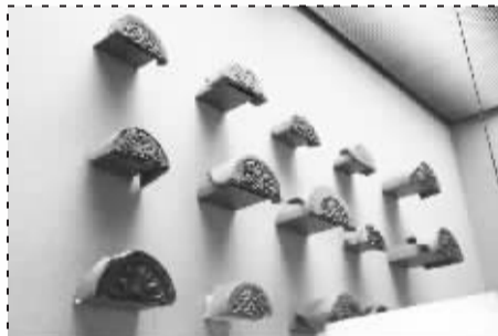
■战国时期燕国瓦当。