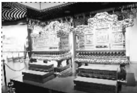
■清朝皇帝金丝楠木龙凤宝座。