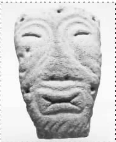
■8000年前的刻陶面具(复制)。