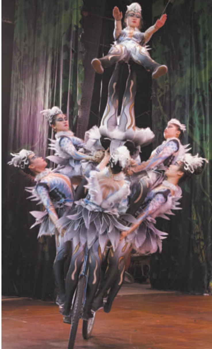
■河北《女子集体车技》

杂技节期间还将推出一系列惠民演出。国际马戏嘉年华将从9月23日至10月8日在石家庄举办,石家庄、沧州还将开展杂技节“进校园、进商场、进景点、进农村”等社区公益演出。