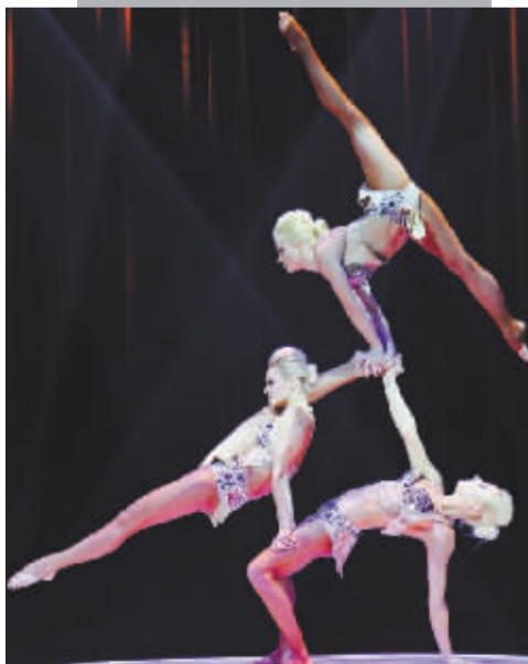
■乌克兰《女子三人技巧》