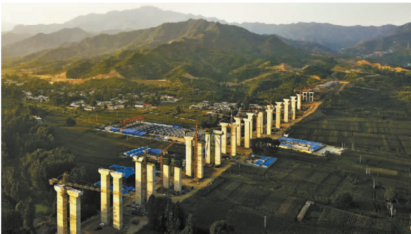
俯瞰建设中的张家庄大桥。