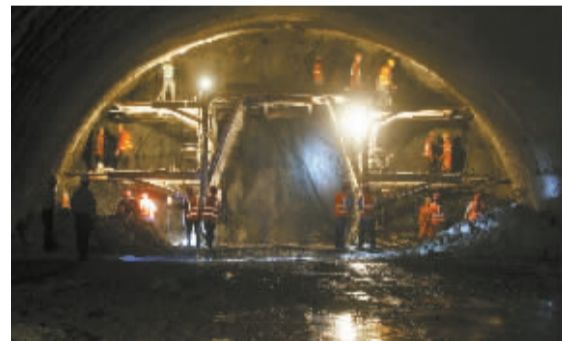
割髭岭隧道, 在工人辛勤的劳作中不断延伸。

八百里巍巍太行是燕赵大地的脊梁, 既有着雄奇壮美的自然景观, 更是革命老区。但由于自然条件差, 交通不便等, 大部分老区至今仍比较贫困, 经济相对落后, 群众生活比较困难。要想富, 先修路。太行山高速全部建成后, 将进一步改善太行山区的交通状况, 带动沿线经济社会发展, 沿线群众也将走上脱贫路、致富路、幸福路。