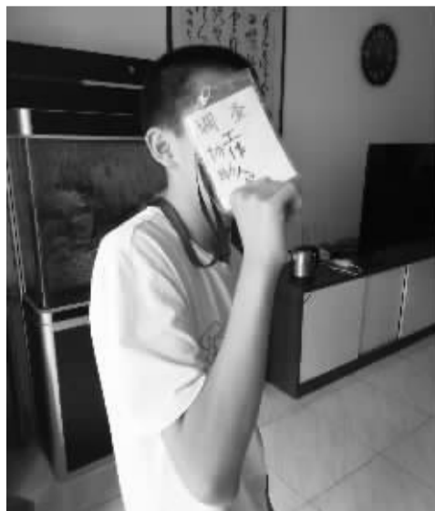
■为便于社会调查,小雨给自己制作了一个胸牌。

课件还用图解的方式,剖析了一个孩子因考试成绩不理想,受到家长一次次刺耳的批评,从而走向绝境的过程。