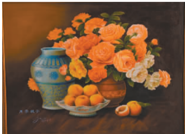
■月季桃子(油画) 刘满起