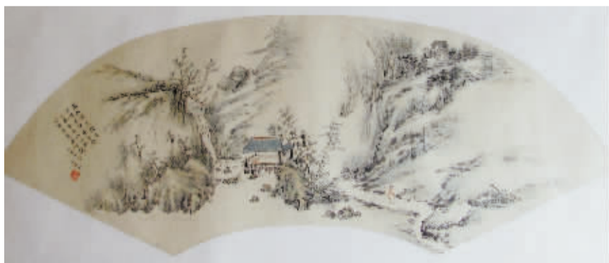
■溪山访友图 尹素哲